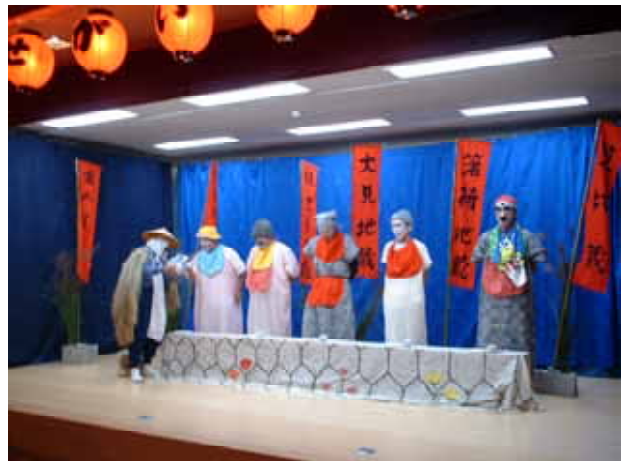
楽久賀喜会の寸劇「珍説・笠地蔵」から (10月10日、箸荷むらづくり館で)

今年も保存会や婦人会の女性たちが化粧を受け持ち、各団体が協力して手づくりの秋祭りができました。